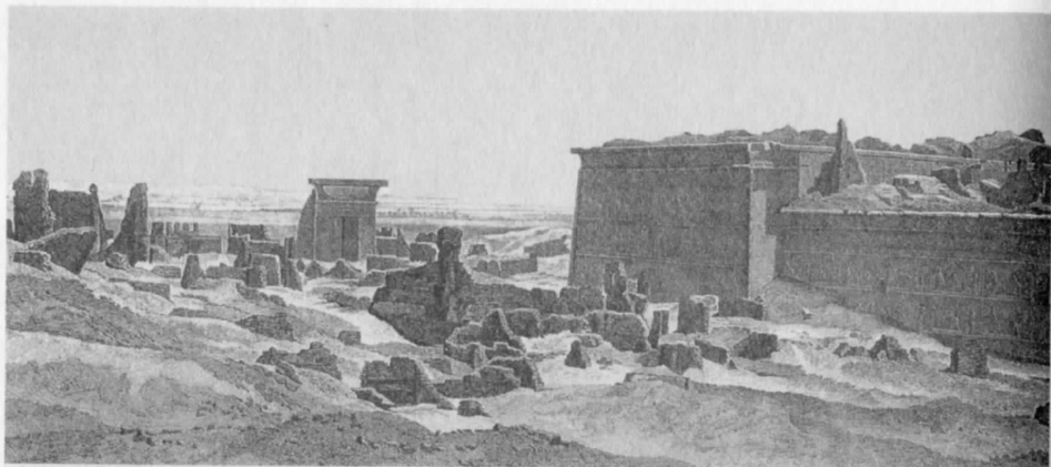
Рис. 2.13. Изглед към Големия Дендерски храм отзад. Картина на пълен разгром. Това, изглежда, е резултат от артилерийски обстрел или са били взривени бъчви с барут, поставени в основите на сградите. От (1100), А. vol.IV, PL.3.