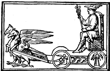
Колесницата на Меркурий