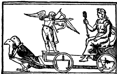
Рис. 3.27. Средновековно изображение на колесниците на планетите Слънце, Луна, Меркурий, Венера. От книгата на Albumasar „De Astru Sciencia“, 1515 г. Книгохранилището на Пулковската обсерватория (Санкт Петербург). Вж. също [543], с. 156, ил. 78–81.

Голямото значение, което астрономите придават на ПРЕПУСКАНЕТО НА ПЛАНЕТИТЕ, личи от това, че моментът на спирането – между прякото и обратното движение – е снабден със специален символ – СПРЯЛАТА КОЛЕСНИЦА. Например в средновековната книга на Албумазар [1004] са показани спрелите колесници на всички планети: Меркурий, Венера, Марс, Юпитер, Сатурн, рис. 3.26 и рис. 3.30.