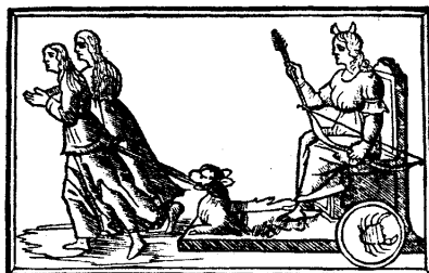
Колесницата на Луната