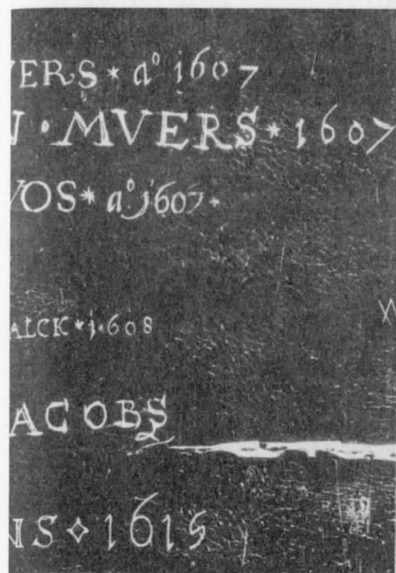
Рис. 6.87. Датите от XVII в. на белгийските медни табелки. Единицата е изписана като латинската буква I – вж. двете горни дати i607, i607 и двете долни – i608, i615, както и латинската буква j в датата j607 по средата. От [1012], Приложение, I/3.