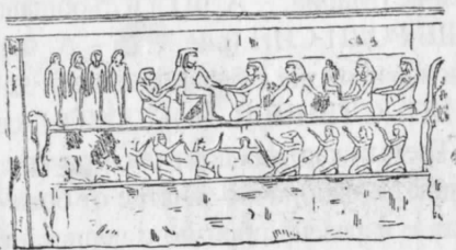
Рис. 7.78. „Древно“-египетско изображение на евангелския сюжет за раждането на Христос и поднасянето на дарове от вълхвите. От [576], с. 81.

ГО ПОЗДРАВЯВАТ (младенеца Христос? – А. Ф.) И МУ ПОДНАСЯТ ДАРОВЕ, а боговете до тях правят същото... Предполагаме, че тук не са необходими повече обяснения“ – завършва Н. В. Румянцев [743], с. 149.