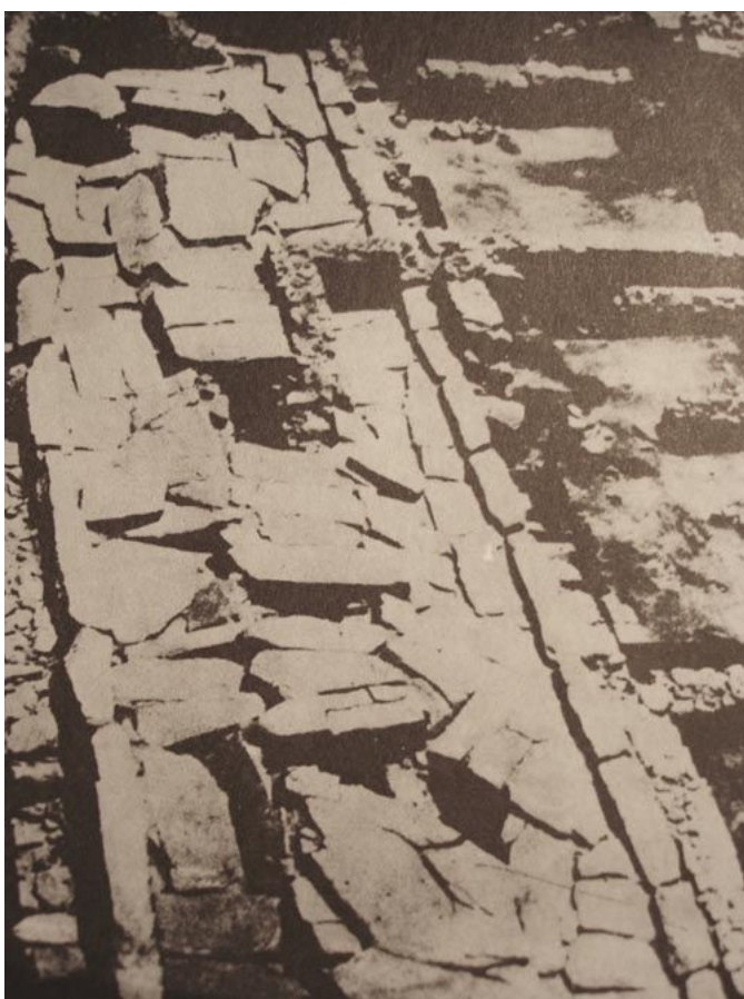
Иллюстрация 4. Отреставрированная античная улица в Пловдиве.