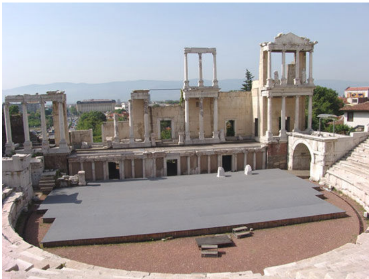
Иллюстрация 1. Реставрированный античный театр в Пловдиве.

Если приедете в Пловдив в конце августа или в начале сентября, когда на смену летней жары пришло изобилие фруктов и овощей, то поймете, что античный писатель Лукиан наверняка прав в одном: это – самый красивый из всех городов. Потому что "... его красота блестит издалика ...".