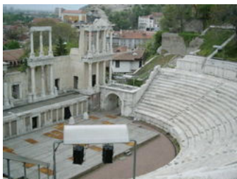
Иллюстрация 2. Реставрированный античный театр в Пловдиве.