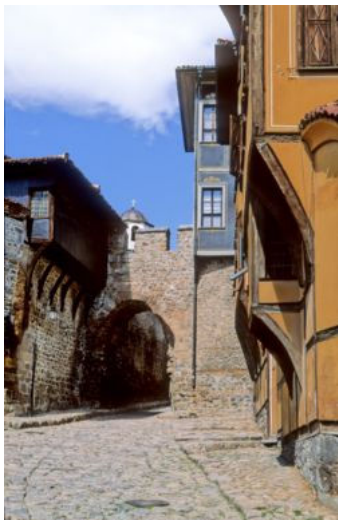
Иллюстрация 3. Улица в старой части Пловдива.