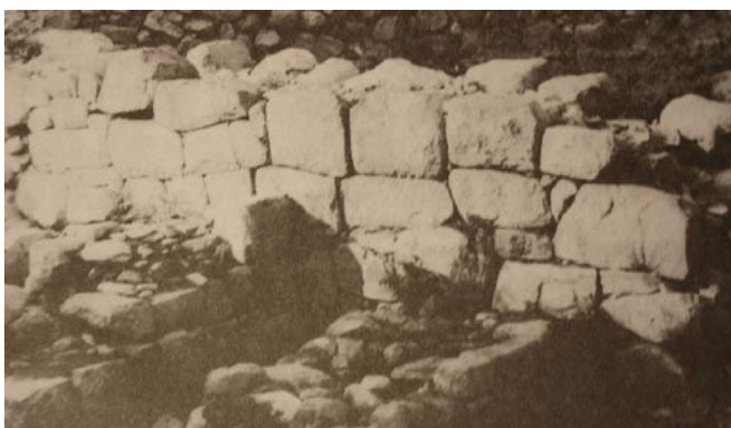
Иллюстрация 5. Крепостная стена Пловдива.