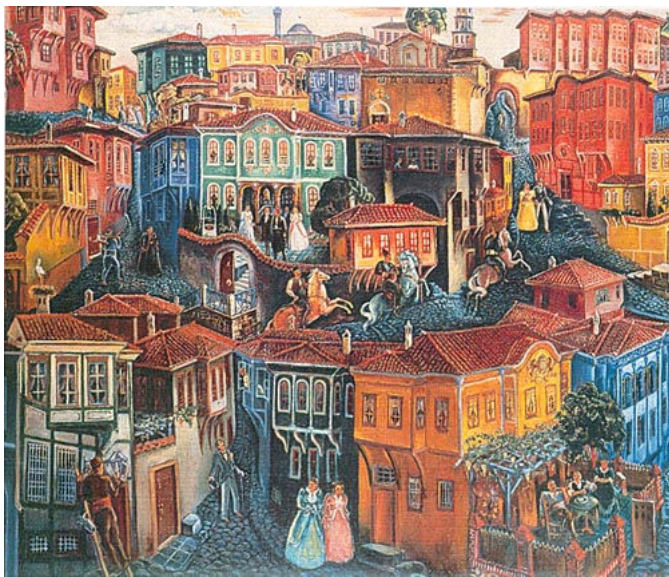
Иллюстрация 7. Старый Пловдив. Картина художника Ц. Лавренова. 1938 г.