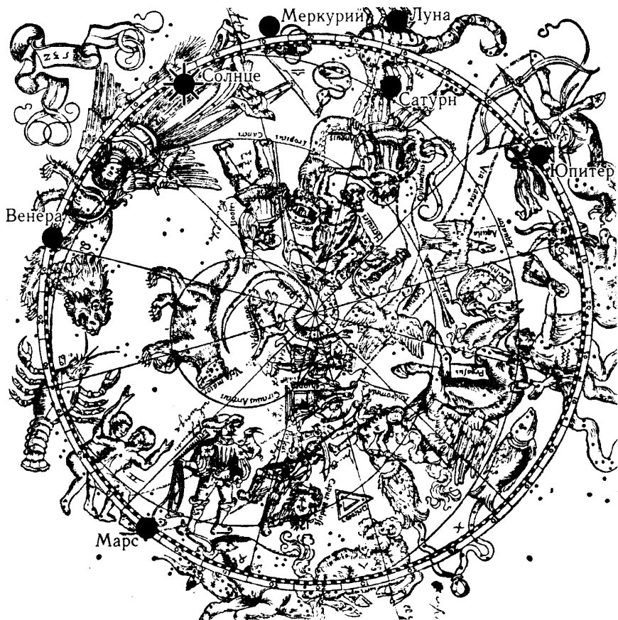
Рис. 3.34. Местоположението на планетите на 1 октомври 1486 г. Ясно се вижда, че всички планети се намират ТОЧНО в съзвездията, посочени в „Апокалипсис“.