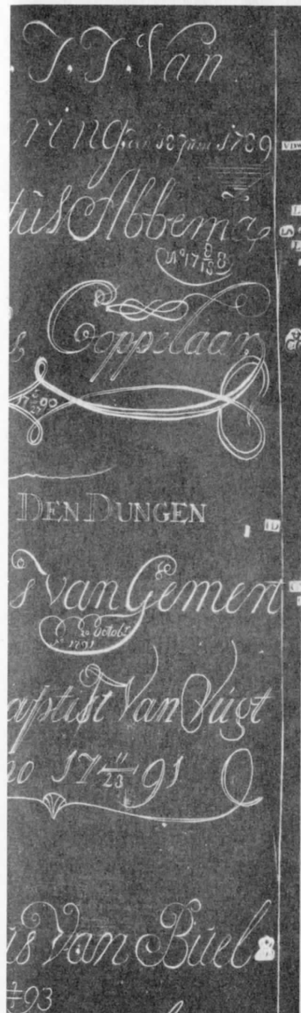
Рис. 6.99. Датите от края на XVII в. на белгийските медни табелки. Изписани са по следния начин: j789, j798, j790, j79j, j79j, j793.